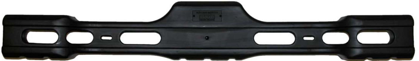
FOTO DEL PARTICOLARE VISTA ANTERIORE