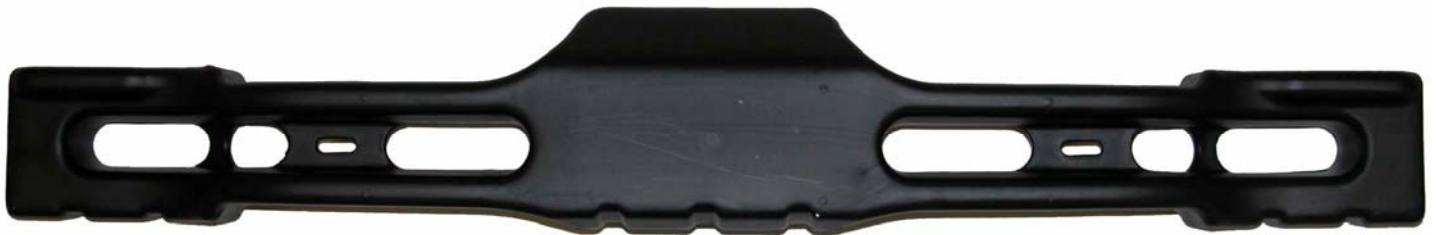
FOTO DEL PARTICOLARE VISTA POSTERIORE